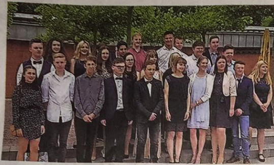
Die Klasse R10a.